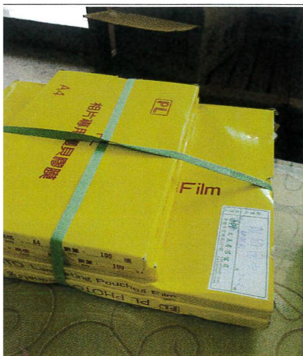
照片簡述： 文具-A3、A4 護貝膠膜 8 組